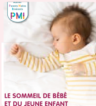
LE SOMMEIL DE BÉBÉ ET DU JEUNE ENFANT