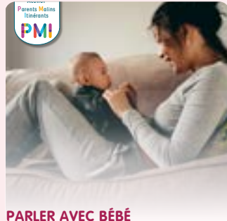
PARLER AVEC BÉBÉ